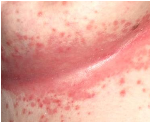
Intertrigo unter der Brust

Die Intertrigo ist eine nässende Entzündung der Haut, die sich in Bereichen entwickelt, in denen Haut auf Haut liegt.